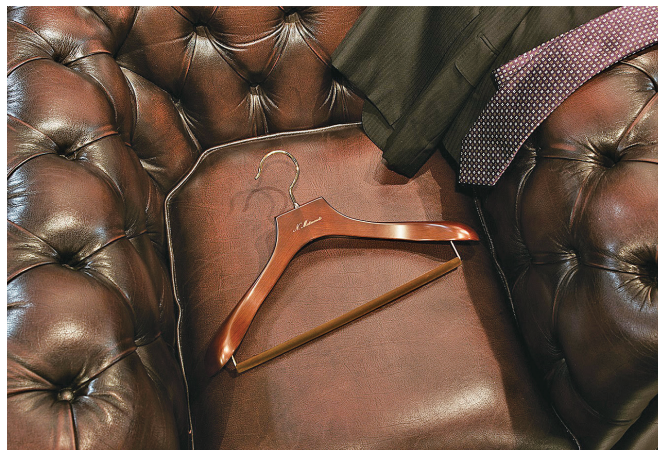
海外でも人気の代表的なハンガー

ものづくりに反映したり、ウェブサイトやショールームを通じて新たな価値を発信することで多様なニーズを創造しています。近年は海外からの問い合わせや注文も増えており、世界一のハンガーブランドになることを目標に活動中。服(福)をかけるハンガーとして、お客様に感動していただけるものづくりを心掛けています。